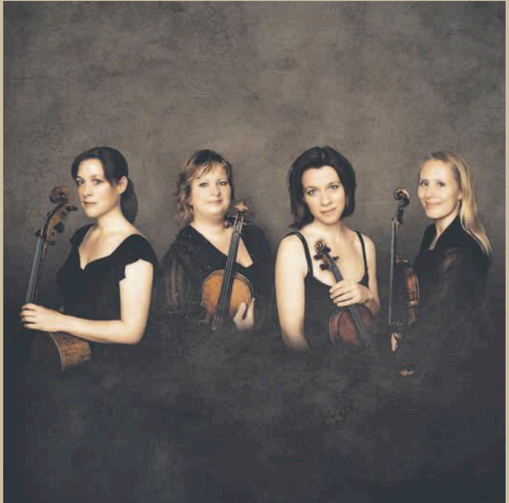
ITOPPSJIKKET: Vertavo er den eneste norske strykekvartetten som opptre på alle kontinenter og som spiller i det øverste, internasjonale toppsjiktet.

LA OSS GJENREISE Edvard Grieg-arven. Institusjoner som jobber med denne bør skaffe seg gode medhjelpere fra alle sjikt av samfunnet samt venner i det offentlige byråkrati og politikk som kan si at nå er det nok. Møtet bør holdes i løpet av relativt kort tid. Jeg kommer. Jeg vet om mange andre som også vil bli med. Kommer du?